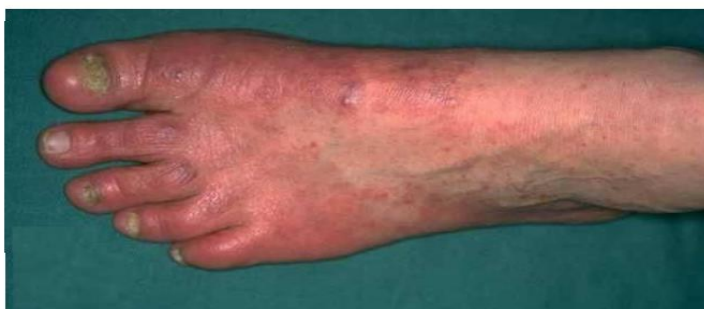
FIGURA 4 ONICOMICOSIS